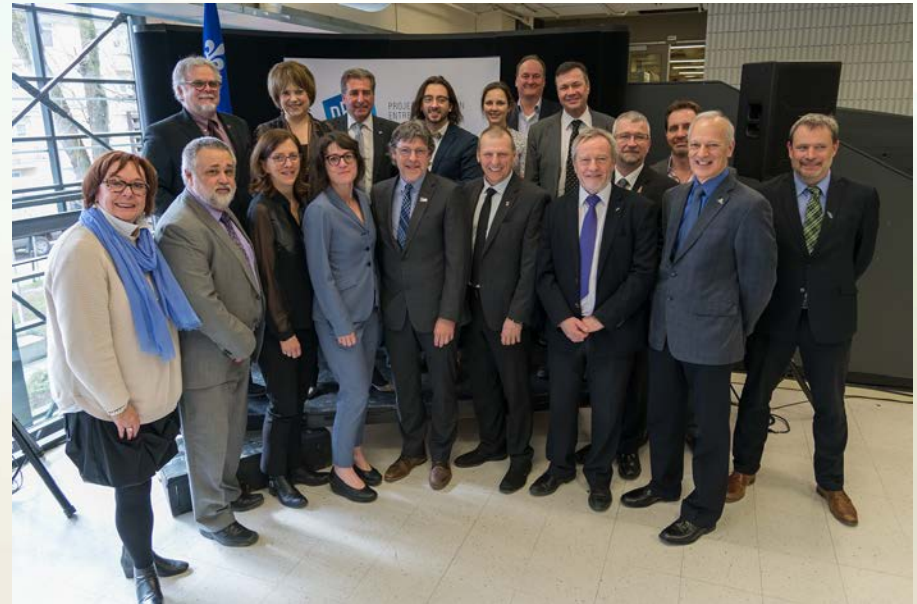
Lancement officiel, le 3 mai 2017