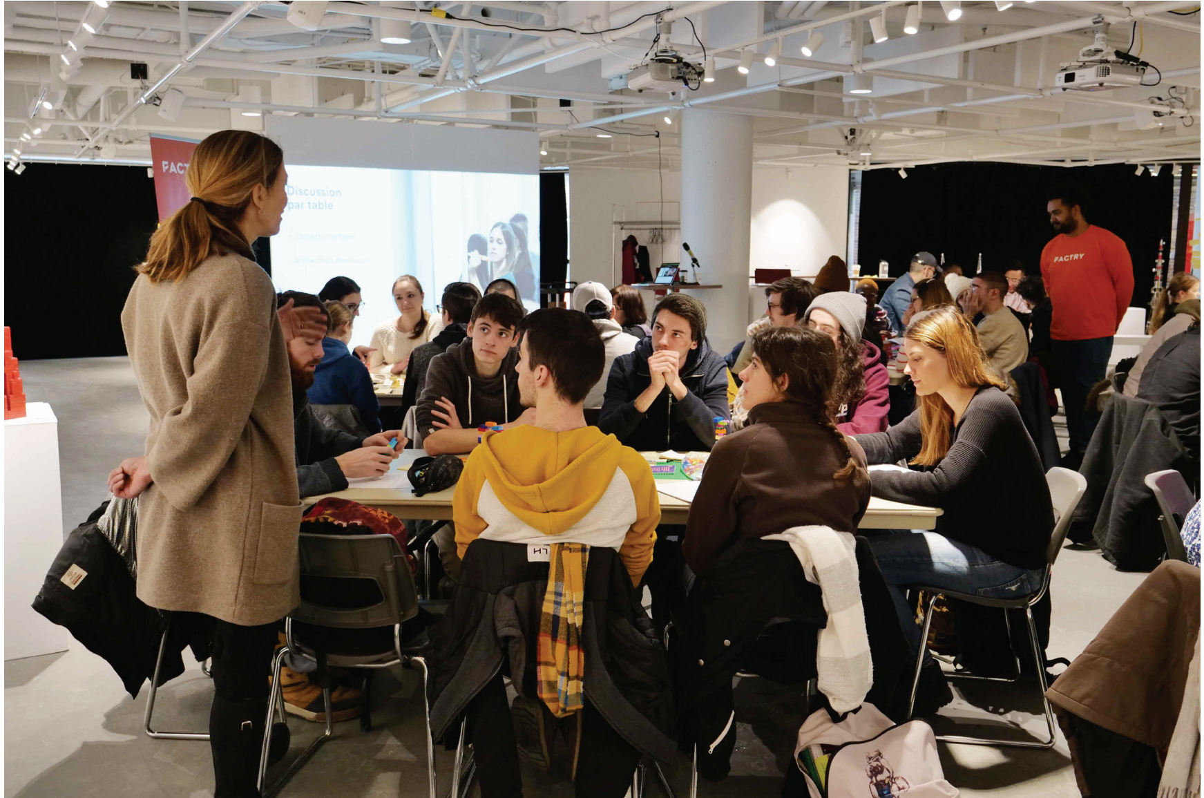
Atelier de créativité (édition 2019)